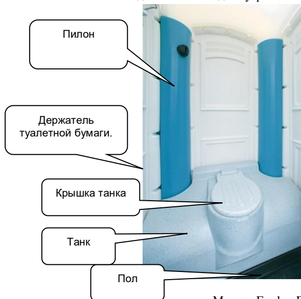
Модель Fresh – вид изнутри: